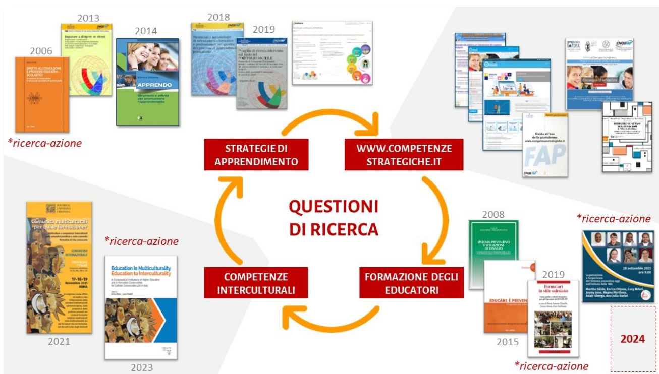
Fig. 1: Pubblicazioni e attività inerenti quattro questioni di ricerca